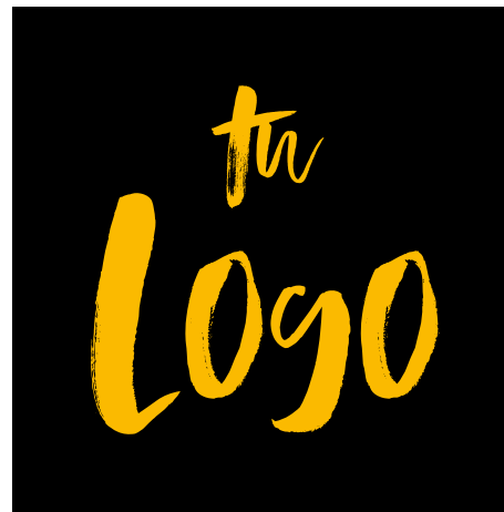
SOBRE FONDO OSCURO