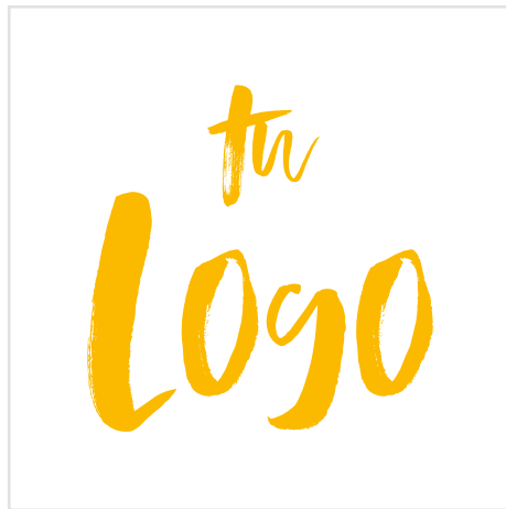
SOBRE FONDO BLANCO